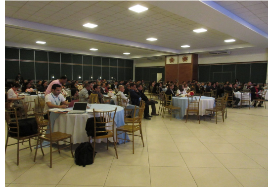
PPP カンファレンスの出席者