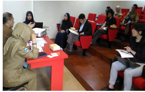
PU バンドン支所に於ける意見交換会