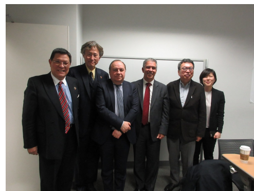
ゲスト講演者との写真撮影