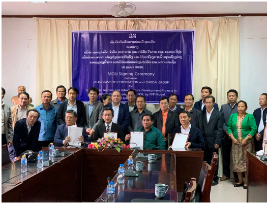
調査報告会後の集合写真