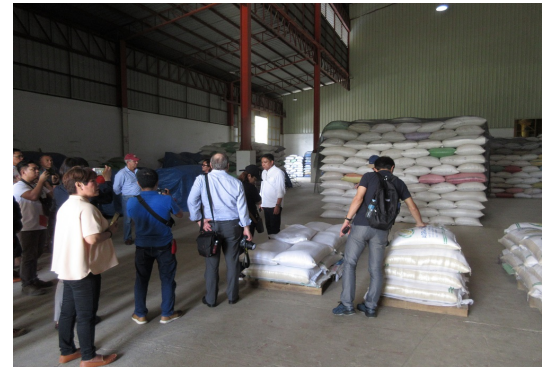
現地検討会：精米施設・保管庫