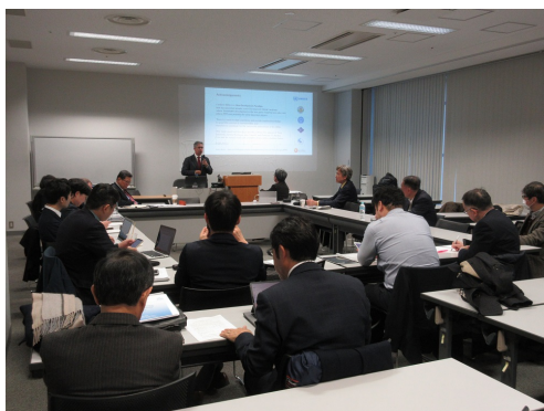
第3回 APPPI オープンセミナー