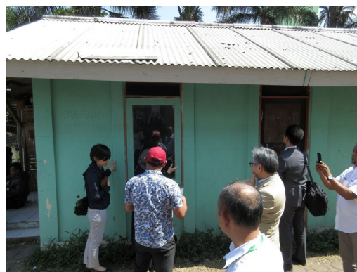
ITB による竹を活用した低価格住宅の視察