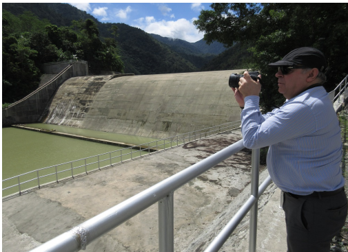
現地検討会：小水力発電施設（8MW）