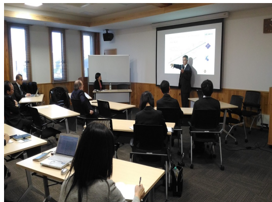
紫波町役場での SDGs に係るレクチャー