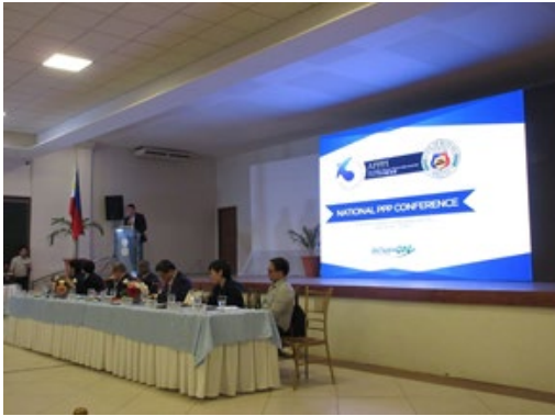
PPP カンファレンスのオープニング

RDAP の現地検討会として、ブトワン市郊外で実施されている小規模水力発電所、ウナギの養殖場（ウナギの加工施設が併設）、給水施設、精米施設等の複数のパイロットサイトを訪問し、当地で同市長及び同市役所職員と意見交換を行った。