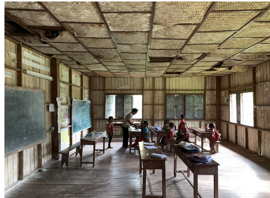
少数民族の小学校に於ける授業