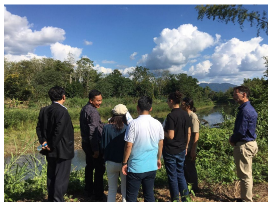
35haの開発予定公有地の視察